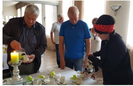
Kuva Vapaaehtoisten kiitosjuhla Anjalassa.