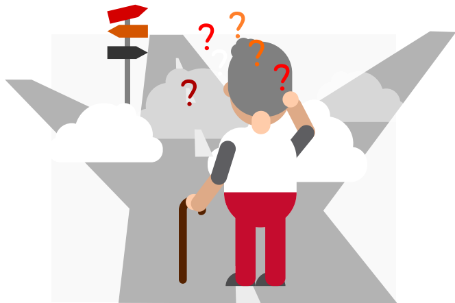
Garashada oo ku adkaata