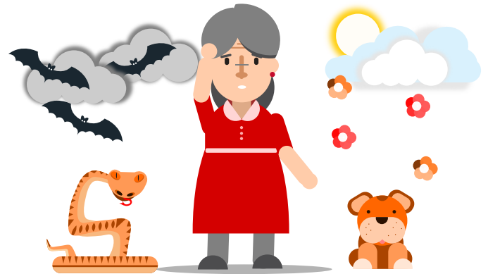
Dhalanteed- mala awaal, sida inuu arko waxaan jirin ama maleeyo waxaan jirin