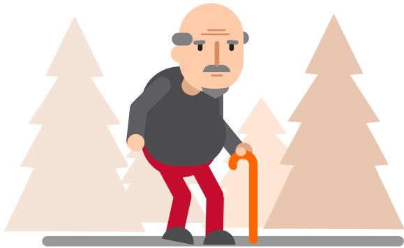
Muruqyada oo tigtigma/ adkaada, talaabo qaadista oo ku adkaata iyo socodka oo ku adkaada